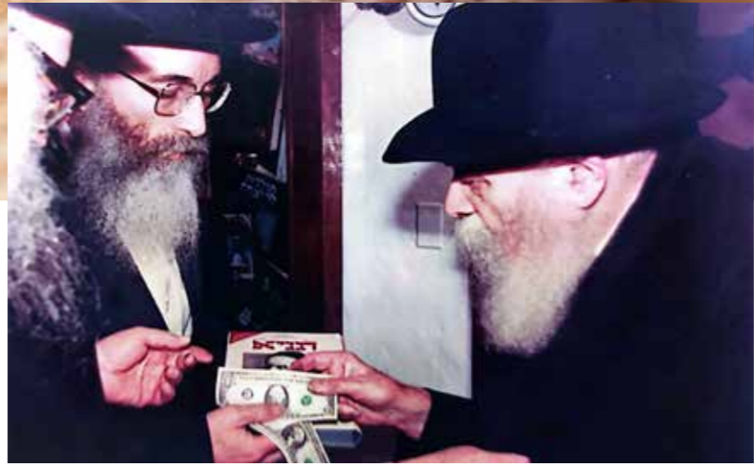
נעומד בפני המלך. הרב סופר מתברך ומקבל 'שליחות מצווה' לאחר שהגיש לרבי מארז הקלטות של שיעוריו בספר 'התניא'