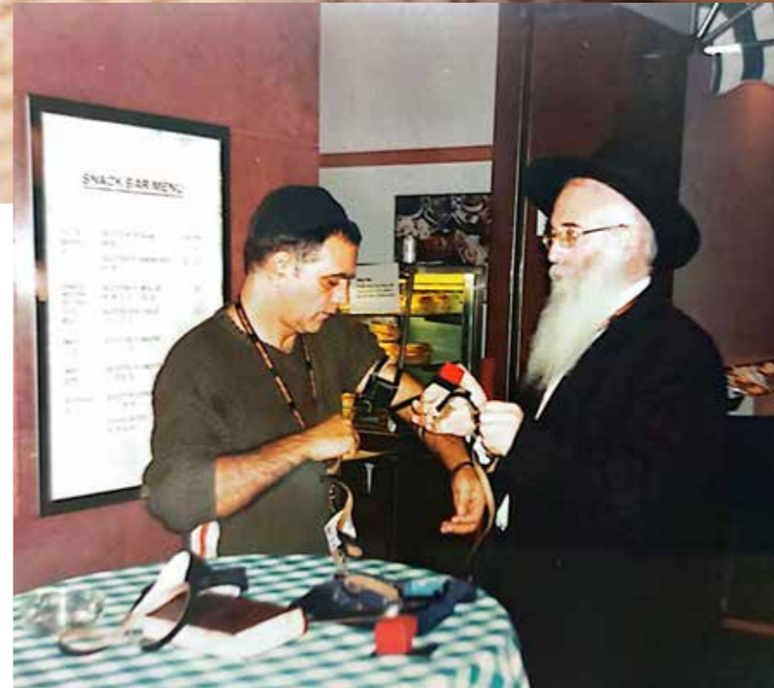
ליישם בסביבתנו את המסרים התוכניים. הרב סופר ב'מצע תפילין' במסעדה

ה' אלוהיכם והיה שם בך לעד"'. אם כן, בספר זה קרא המלך בכל שנה ושנה ביום הכיפורים וכן ב'מעמד הקהל' בחול המועד סוכות במוצאי השנה השביעית. החידוש הזה מתחבר יפה למטרה הרעיונית של מעמד ייחודי זה - של הקהל - על פי ניסוח הרמב"ם: