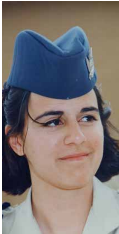
חינוך לאהבת המדינה. בימי השירות כקצינה